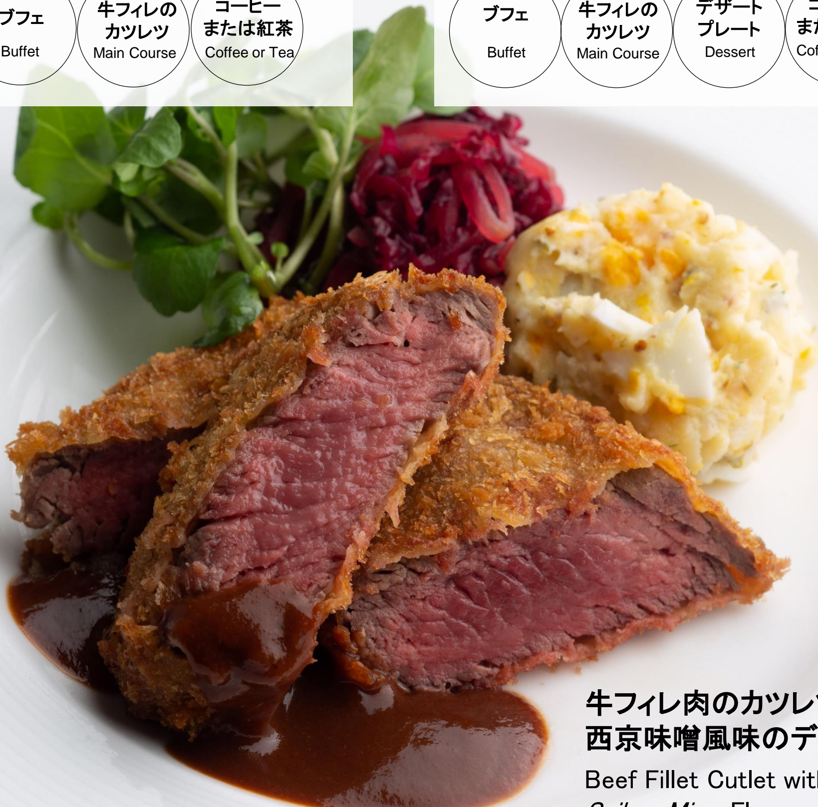
牛フィレ肉のカツレツ 西京味噌風味のデミグラスソース

Beef Fillet Cutlet with Saikyo Miso-Flavored Demi-Glace Sauce